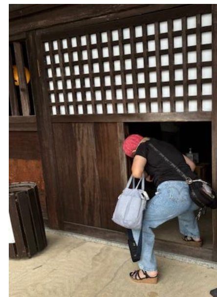
鼠木戸 (ねずみきど)