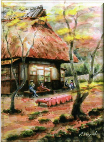
2017年 水彩画同好会 第31回記念作品展より 作品名: 明かり 作者: 三好理照氏