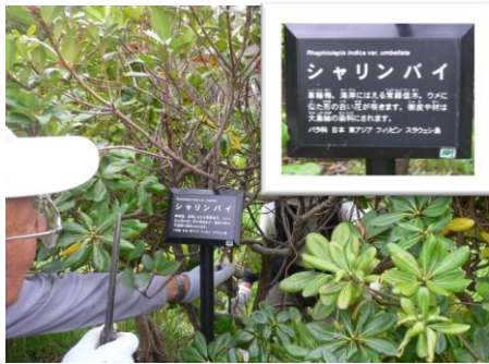
樹木名(10種類)のプレートを設置 写真はシャリンバイ