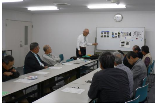
4/28(木) 年次総会を 奈文研会議室で開催