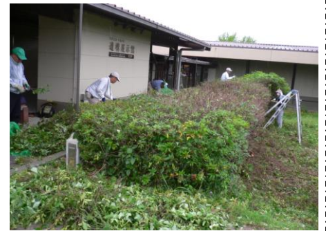
大きなサツキを剪定 (遺構展示館)