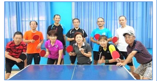
< 卓球部会のメンバー >