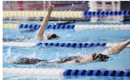
得意の背泳ぎで力泳！（手前）

年に5回、競泳の大会にエントリーして、時々メダルや賞状をもらいます。背泳ぎが得意で平泳ぎは苦手です。