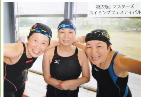
お仲間と競泳大会に出場（右端）

昨年チャレンジして途中リタイアした800m自由形のリベンジに、いま密かに燃えています。椎間板ヘルニアは、まだ完治していませんが、水泳は68歳の私の大切な支えなので、できる限り楽しく続けたいと思っています。