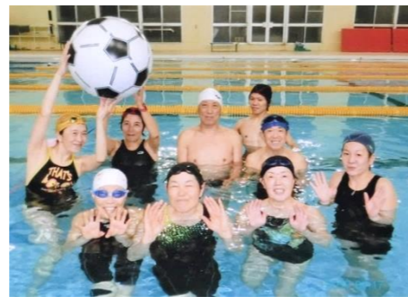
水中バレーのメンバーと（前列中央）