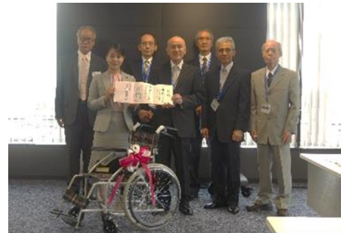
車いすと共に記念写真