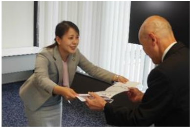
川田市長に寄贈目録を手渡す