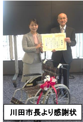
川田市長より感謝状