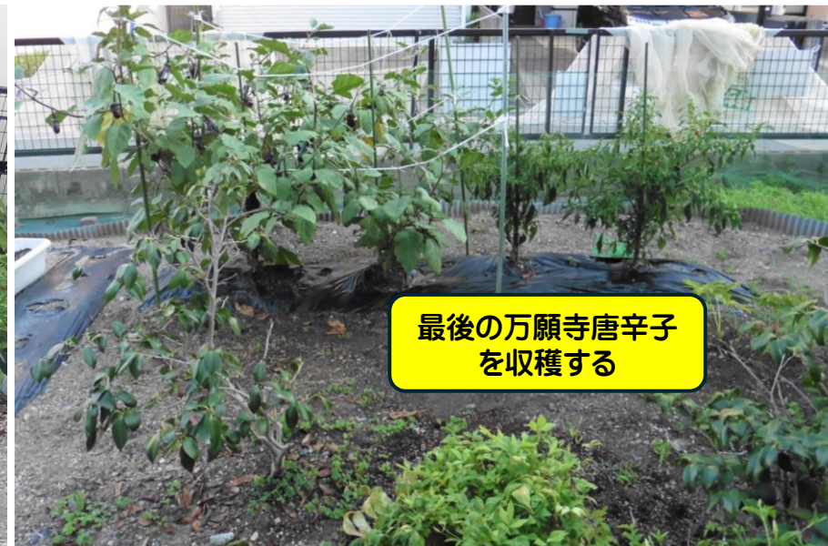
最後の万願寺唐辛子を収穫する