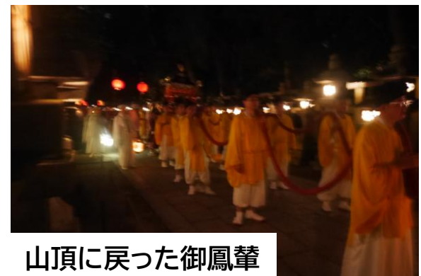
山頂に戻った御鳳輦