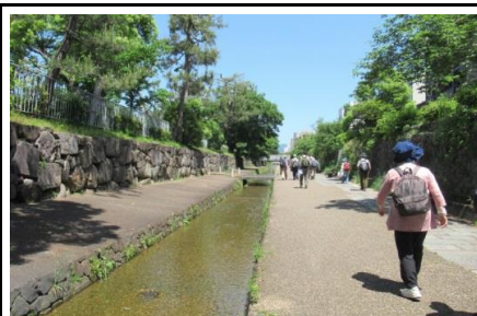
堀川遊歩道・二条城築城の石垣