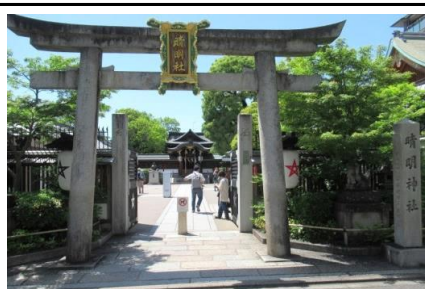
晴明神社正面鳥居