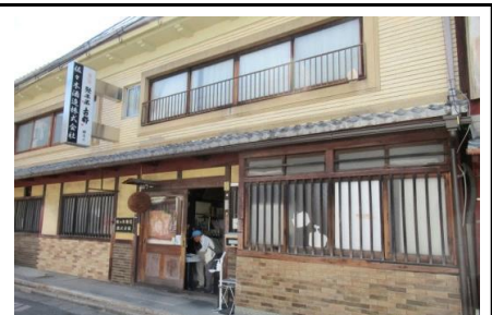
佐々木酒造株式会社