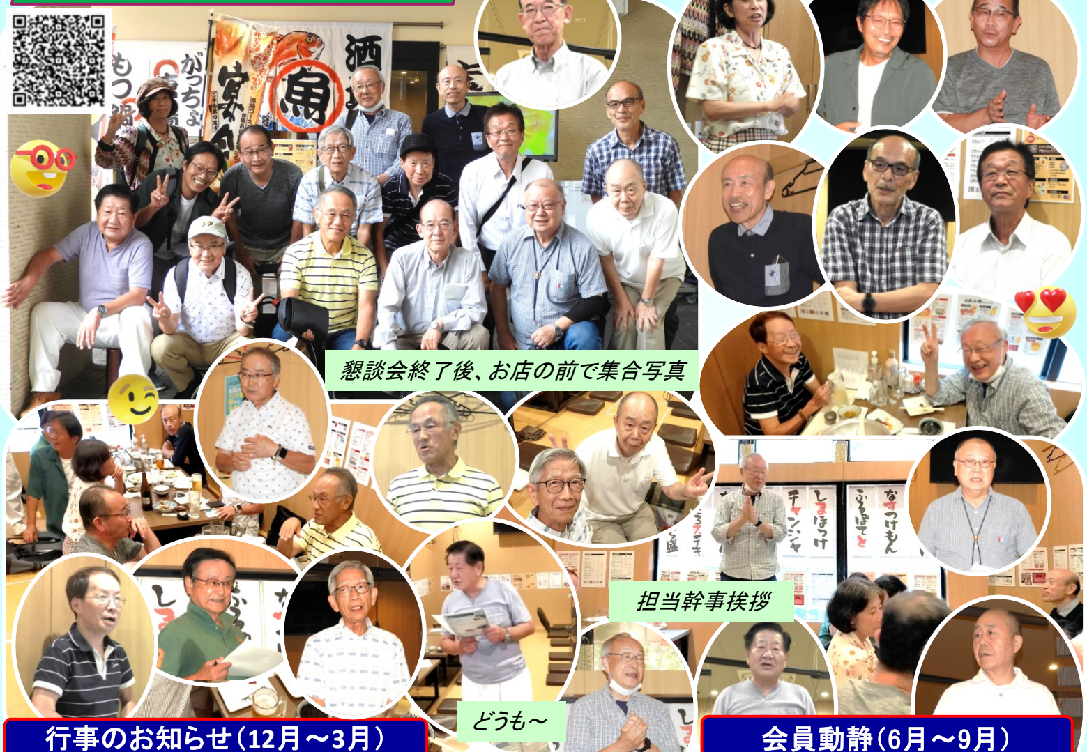
懇談会終了後、お店の前で集合写真