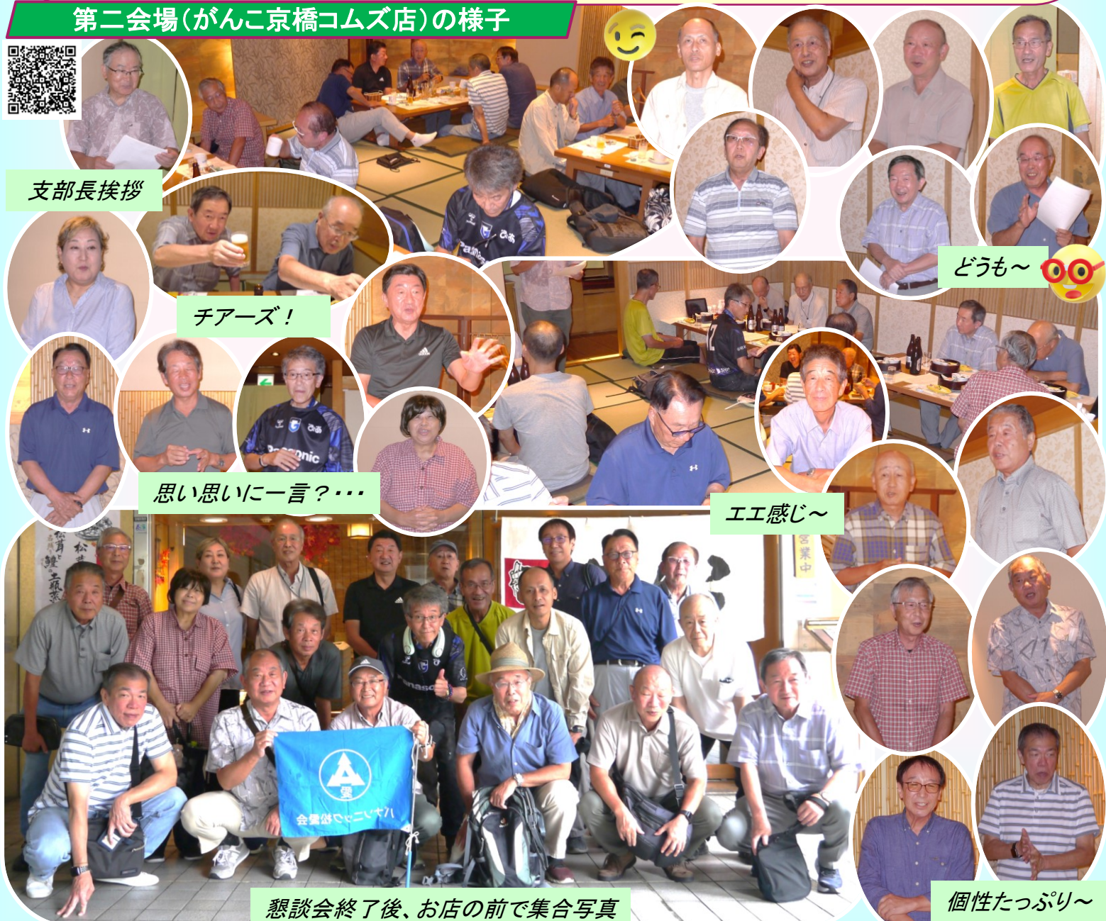
懇談会終了後、お店の前で集合写真