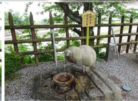
太閤秀吉の「出世の泉」