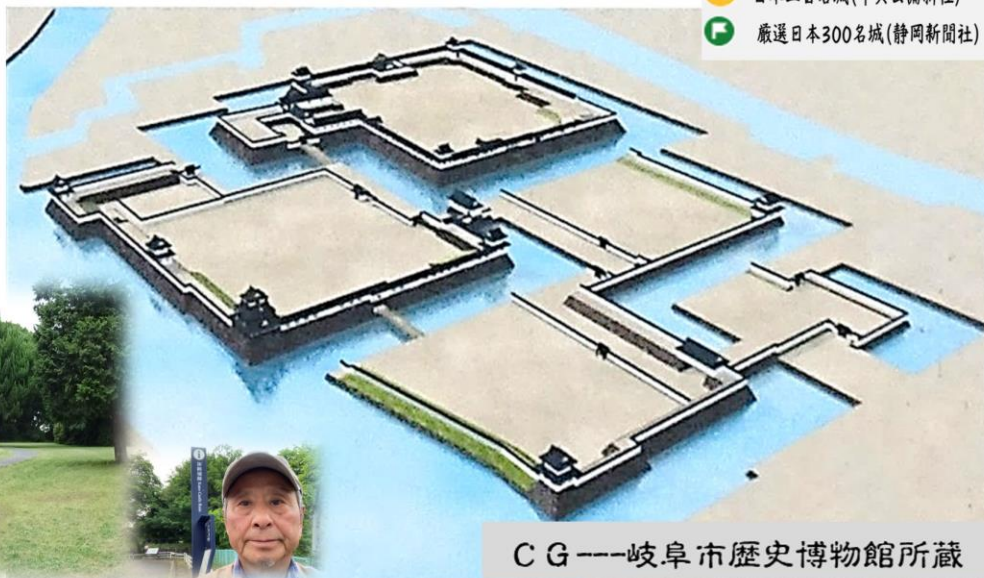
CG --- 岐阜市歴史博物館所蔵