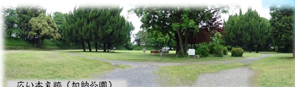
広い本丸跡 (加納公園)

広い本丸跡は近隣市民の憩いの場となっており、周囲を土塁で囲まれているためか 夜間は施錠されています。本当に普通の平和時の平城という感じでした。