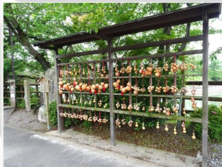
ひょうたん(秀吉の馬印)