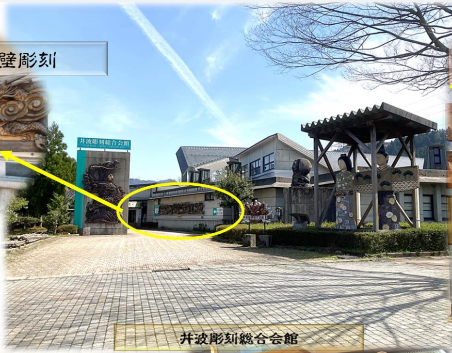
井波彫刻総合会館