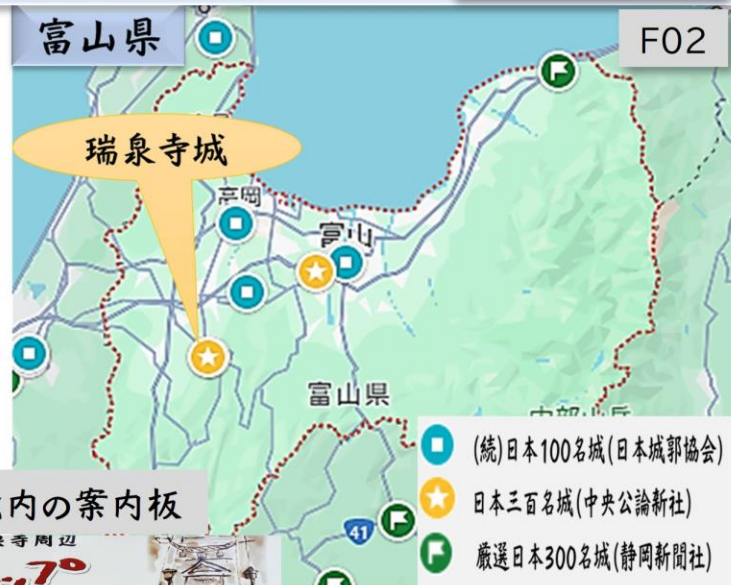
井波八幡宮境内の案内板