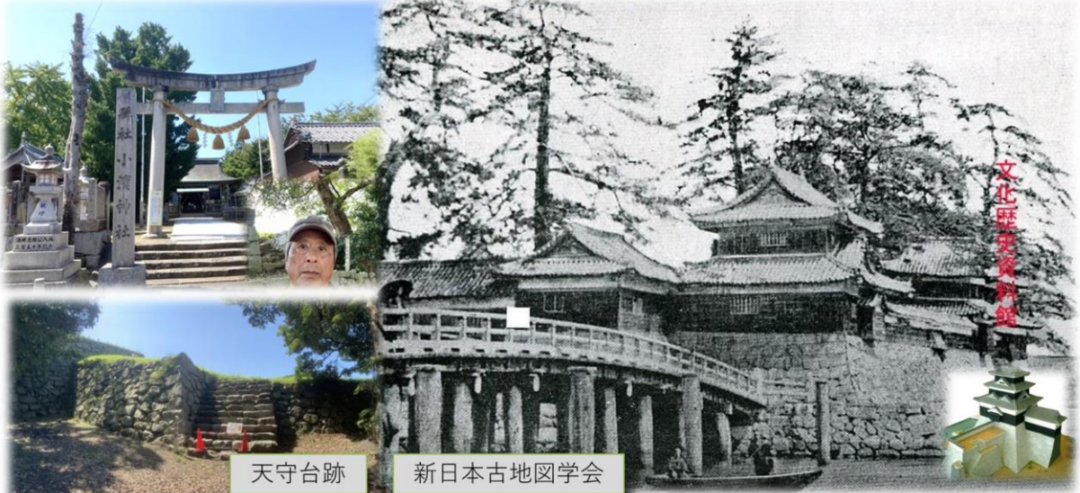
天守台跡 新日本古地図学会