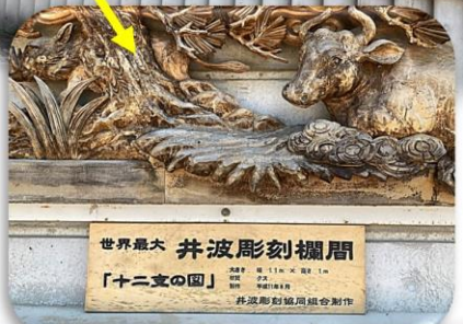
世界最大 井波彫刻欄間 「十二支の図」 井波彫刻協同組合制作