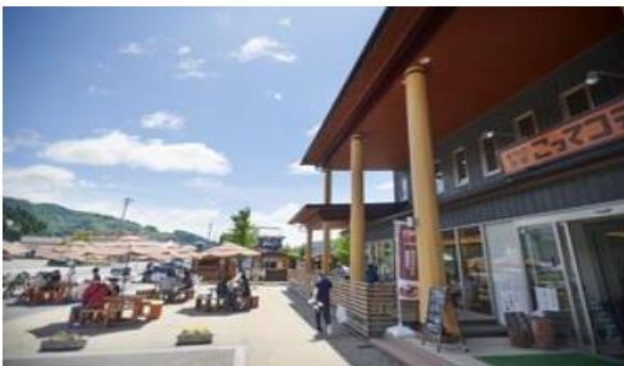
こってコテいけだ前