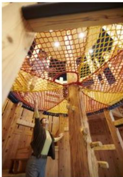
森のアスレチック