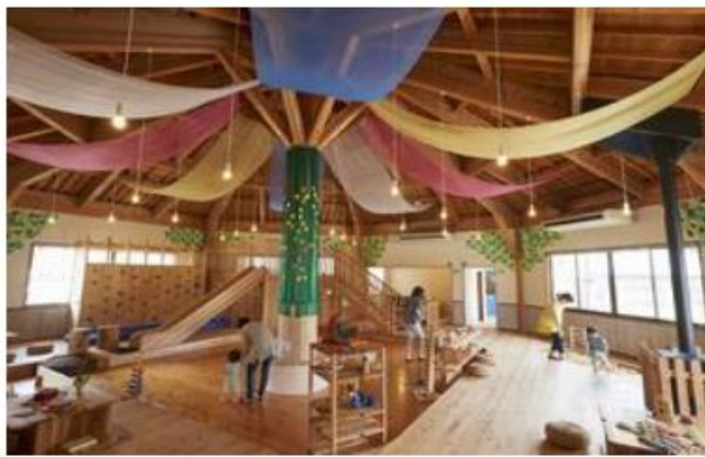
おもちゃハウス内観