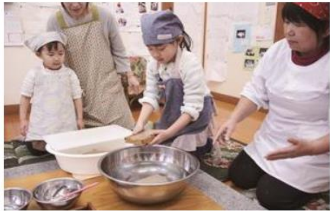
こんにゃく作り体験

むかしから水はけのよい土地柄をいかし受け継がれてきた魚見（うのみ）地区のこんにゃくづくり。魚見手作りこんにゃく道場では、こんにゃく作り体験ができます。