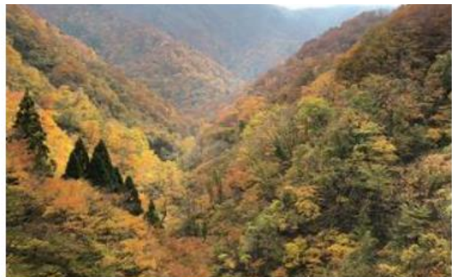
林道からの眺め（11月上旬撮影）