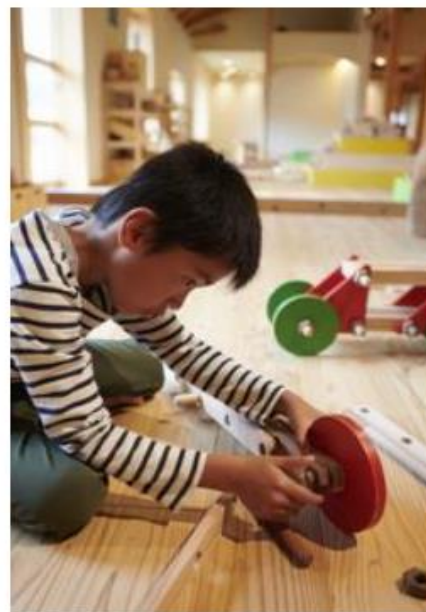
組立ておもちゃホール