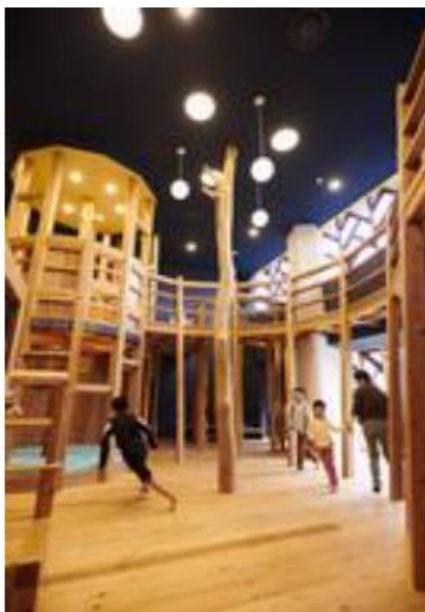
森のアスレチック