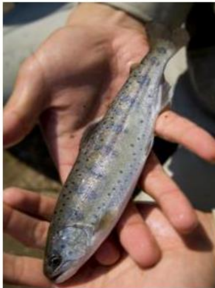
Fishing pond (Amaike Inn)