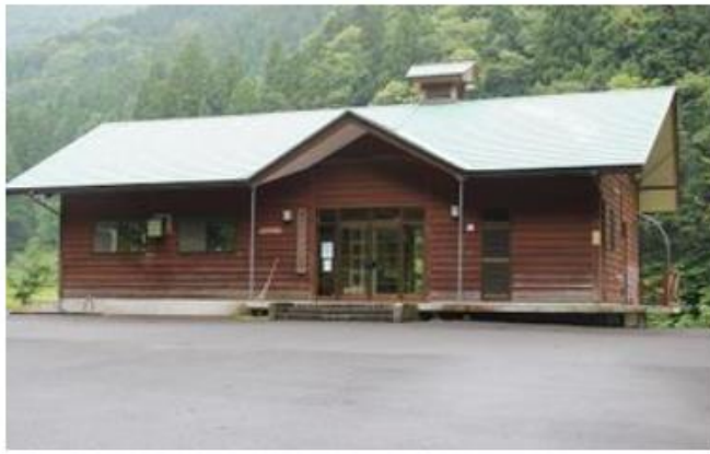
こんにゃく道場外観