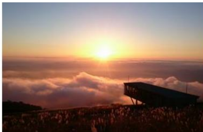
秋の夕暮れは雲海が見られることも