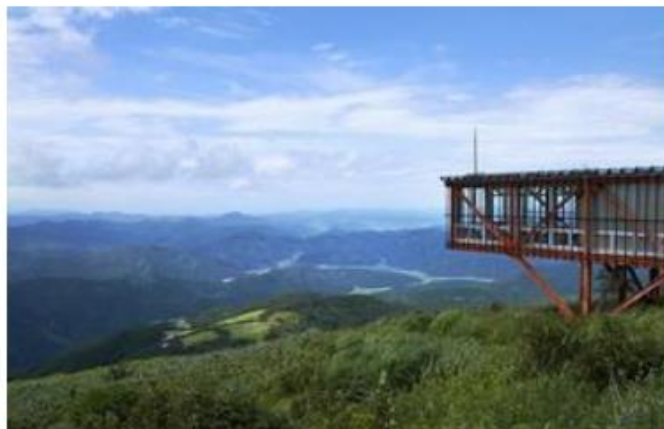
部子山から見える池田町