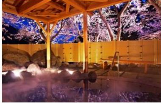
桜の頃の露天風呂