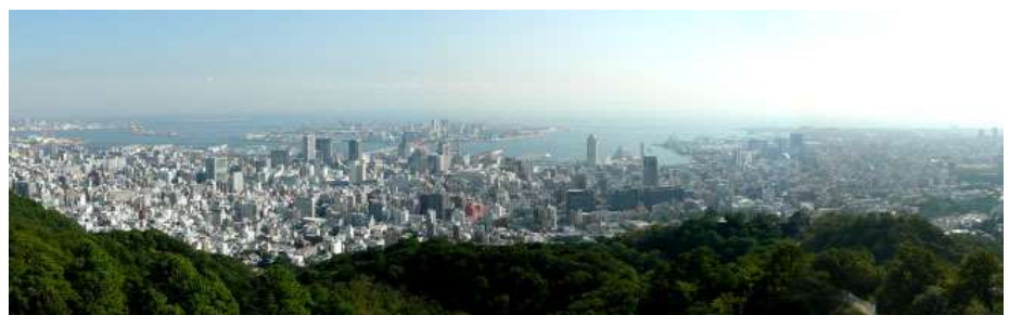
ビナスブリッジより神戸の展望