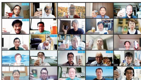
【参加者全員で乾杯！】

終了後のアンケートでは総じて松愛会活動に興味を持っていただけ積極的に行事に参加したいと言う意見が多く寄せられました。