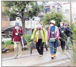
【西三荘ゆとり道を歩く】

ウォーキング&バーベキューを11月11日(木)に実施いたしました。参加は前回(2019年)より16名少ない45名となりましたが、久々の行事開催に多くの方に参加いただきました。当日はあいにくの小雨に見舞われましたが、皆さん元気に