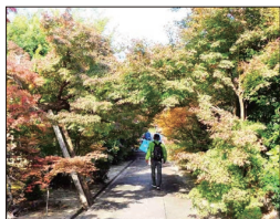
【真宗院 もみじの参道】

【宮永さんの解説(墨染寺にて)】て、石造アーチ橋を渡り、西岸寺を後に名神高速道路の高架下沿いを歩き深草瓦町公園にて昼食を摂りました。